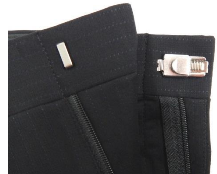
1.5センチの稼働を持たせたウエストカン 自然に体にフィットする

商品名 : クールビズ・ファイテンニットスーツ 発売日 : 4月28日(金) 価格 : 73,000円(税抜) 素材 : ポリエステル100% カラー : ブラック/ネイビー サイズ : Y、A、AB体 各4~7号