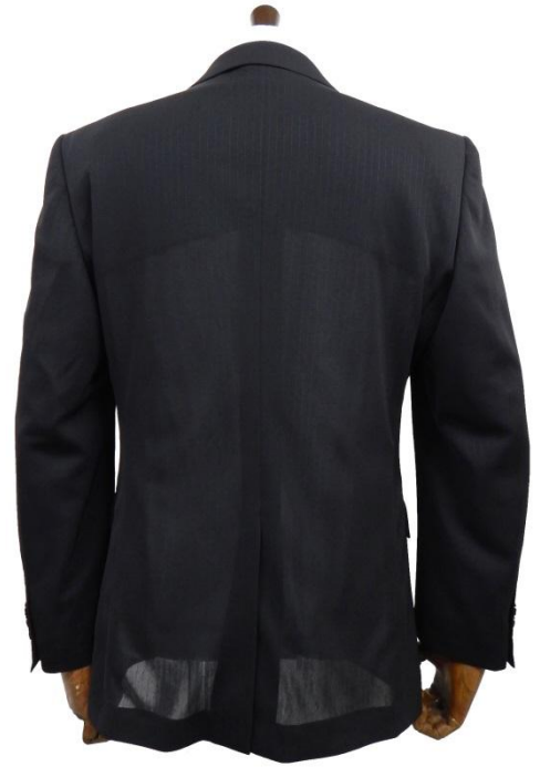
薄手の生地でありながら、透けにくく冷涼な着心地