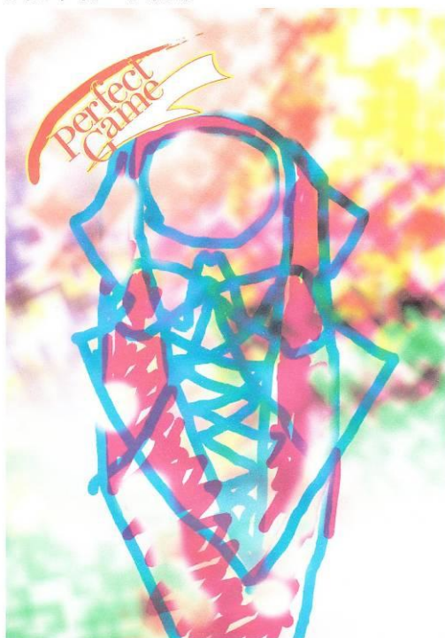
ブランドイメージポスター

高度な技術を要する特殊仕様のもみ玉パイピングを採用。 目の粗い素材でもロックが掛かっている為、外れる心配が無く、 極細パイピングで美しい仕上がり。