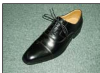
ストレートチップ